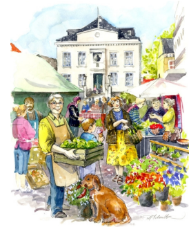
Dine grøntsager, fisk, frugt, kød eller brød solgt på Ø-havsmarkedet?

Ø-havsmarkedets kontakt informationer og hjemmeside: http://oehavsmarkedet.dk/forside.html