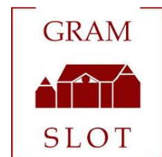
Besøg Gram slot med fødevarer-netværket her i maj.