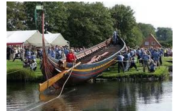
Havhingsten sesattes igen den 2. April efter 1 år på land.

Havhingsten og vikingeskibsmuseet er groft sagt her for at blære sig. Der bliver kørt et stort medie apparat i gang fra deres side, og vi vil selvfølgelig gøre vores her hos TEL og fødevarer-netværket mht eksponering for jer der bidrager, uanset om det er lidt eller meget. Hvis alle kan finde bare lidt, eller en branche gå sammen om, at finde til 60, så klarer vi det. Der skal være til